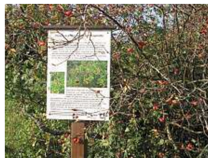
Infotafel am Heckenlehrpfad