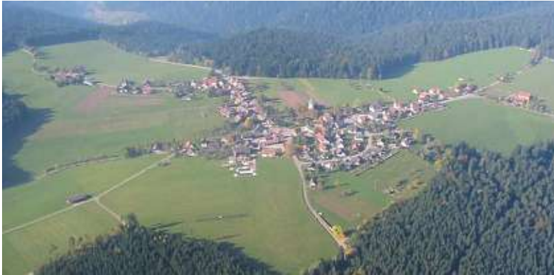
Luftbild von Schömburg

Gemeinde Loßburg, Landkreis Freudenstadt, Regierungsbezirk Karlsruhe