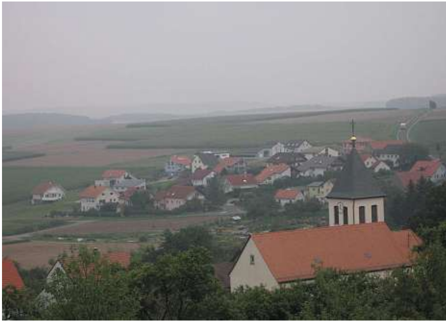
Kirche mit Blick auf den Ort

Stadt Grünsfeld – Main-Tauber-Kreis – Regierungsbezirk Stuttgart