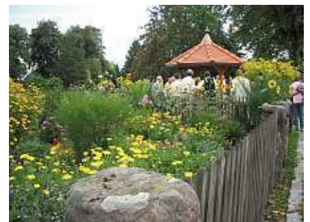
Dorfbrunnen mit Bauerngarten