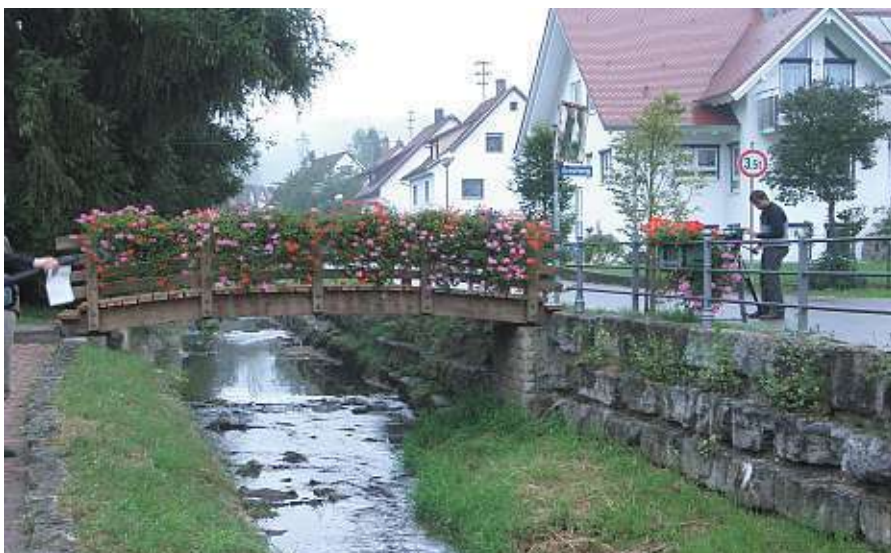
Renaturierung des Schlierbaches

Die Bürger des Dorfes Niederalfingen erhalten für herausragende Leistungen in Dorf, Landschaft und Gemeinschaft eine Auszeichnung in Silber .