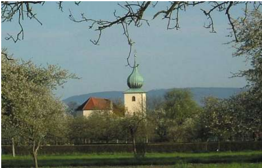
Blick auf die Kirche

Stadt Rastatt, Landkreis Rastatt, Regierungsbezirk Karlsruhe