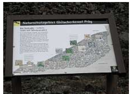
Infotafel Gletscherkessel Präg