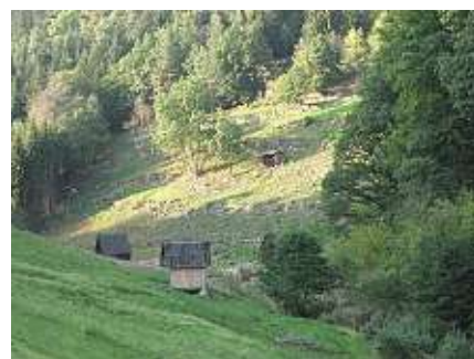
Offenhaltung der Kulturlandschaft