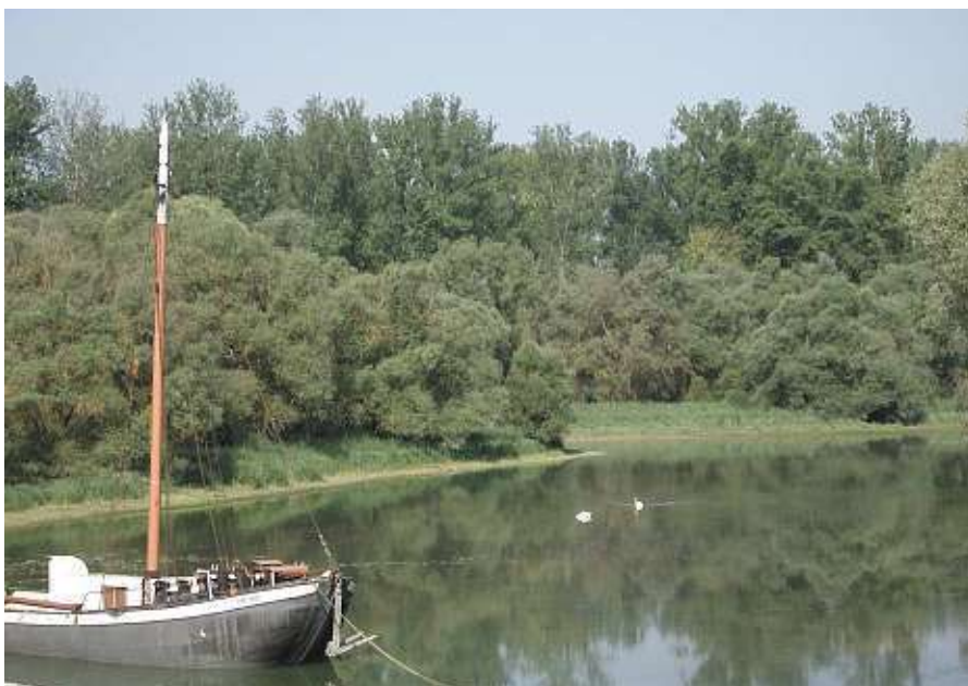
Naturschutzgebiet Rastatt Rheinaue

Die Bürger des Dorfes Wintersdorf erhalten für herausragende Leistungen in Dorf, Landschaft und Gemeinschaft eine Auszeichnung in Silber .