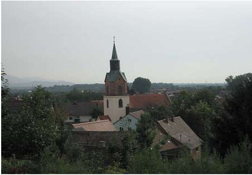
Blick auf den Ort

Stadt Renchen, Ortenaukreis, Regierungsbezirk Freiburg