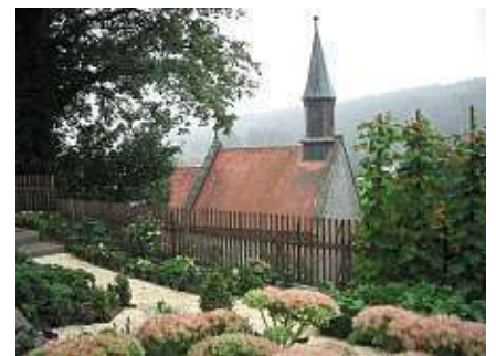
Kräutergarten mit Blick auf Kapelle