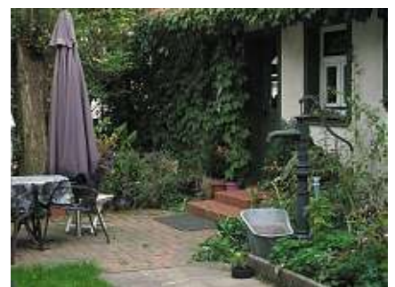
„Tag der offenen Gartentür“